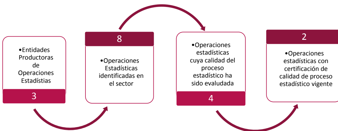
Gráfico 1. Principales características de la producción estadística del sector de Tecnologías de la información y las comunicaciones