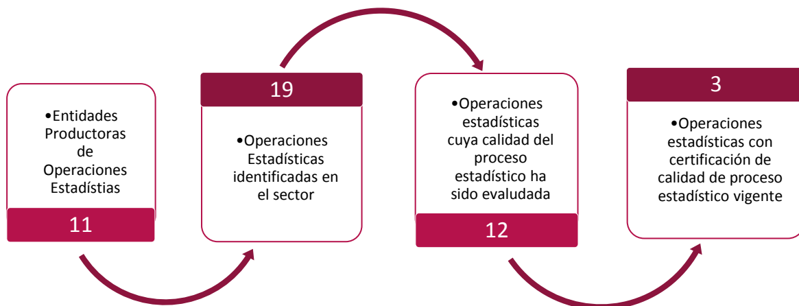
Gráfico 1. Principales características de la producción estadística del sector de Seguridad y Defensa