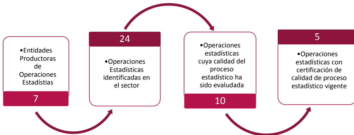
Gráfico 1. Principales características de la producción estadística del sector de salud