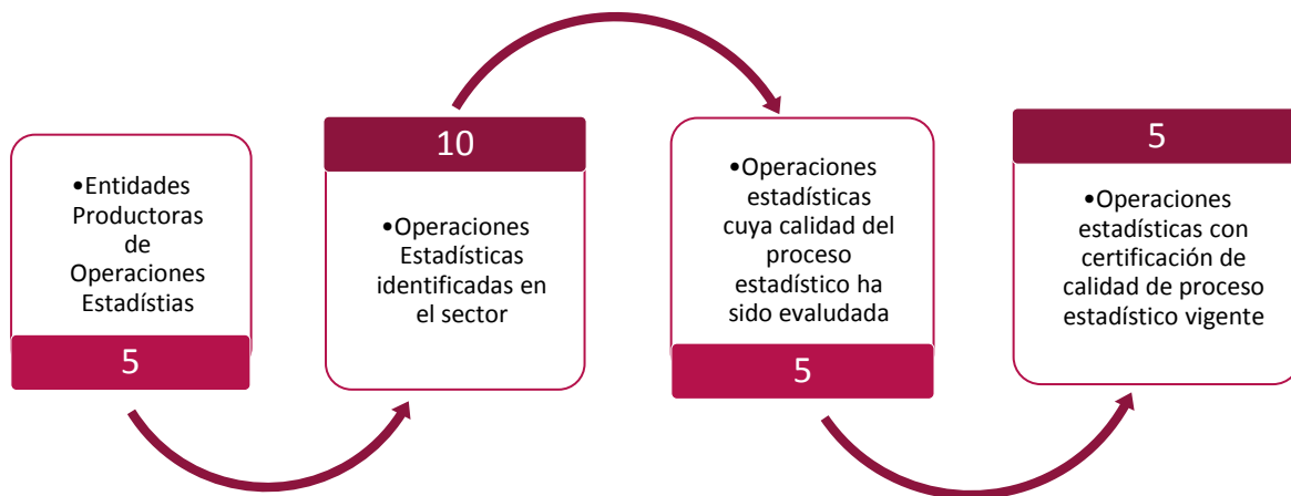
Gráfico 1. Principales características de la producción estadística del sector de Industria Manufacturera