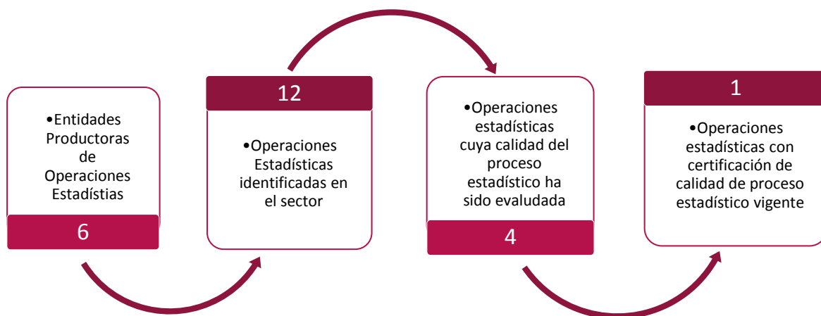
Gráfico 1. Principales características de la producción estadística del sector de Cultura