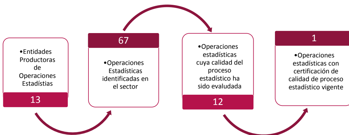
Gráfico 1. Principales características de la producción estadística del sector de Agricultura, Ganadería y Pesca