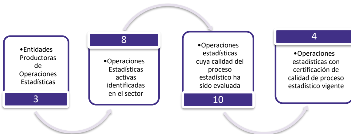
Figura 1. Principales características de la producción de operaciones estadísticas del sector Nivel, Calidad y Condiciones de vida