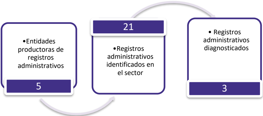
Figura 3. Principales características de la producción de registros administrativos del sector Nivel, Calidad y Condiciones de vida