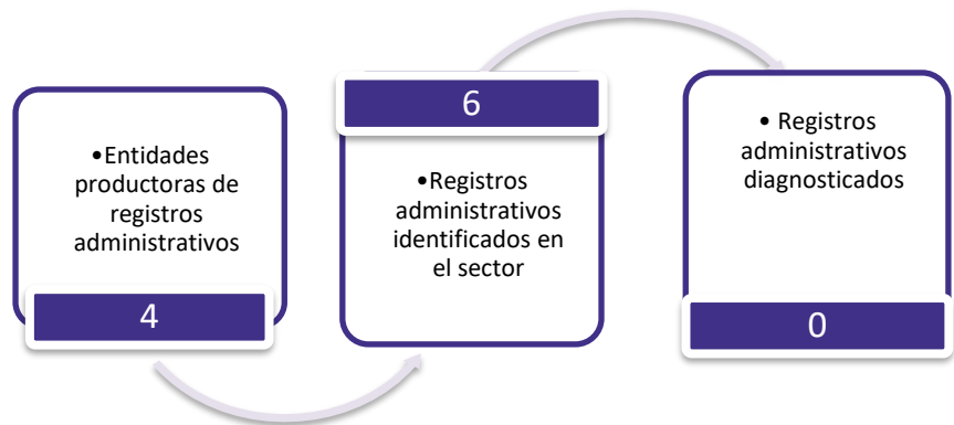
Figura 3. Principales características de la producción de registros administrativos del sector de Construcción

Fuente: DANE – DIRPEN. Inventario de registros administrativos con corte a 31 de octubre de 2024