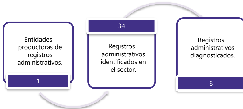
Gráfico 2. Principales características de la producción de registros administrativos del sector de Servicios Públicos Domiciliarios