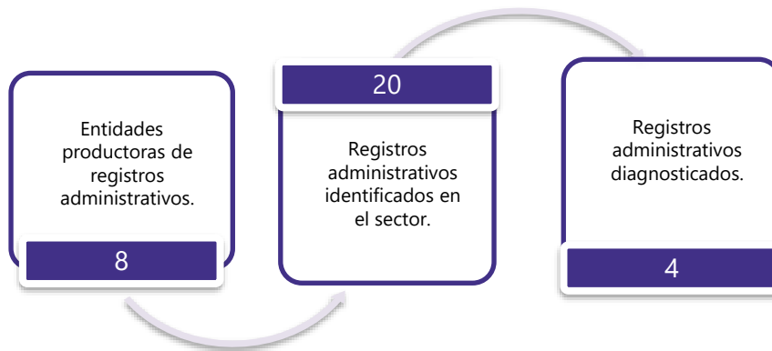
Gráfico 3. Principales características de la producción de registros administrativos del sector de Seguridad y Defensa