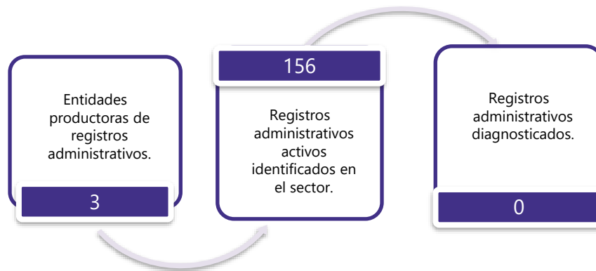
Gráfico 3. Principales características de la producción de registros administrativos del sector de Moneda, Banca y Finanzas