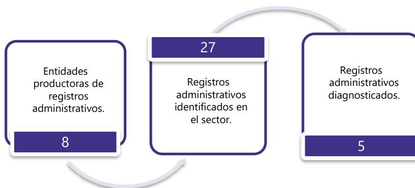
Gráfico 3. Principales características de la producción de registros administrativos del sector Minero Energético