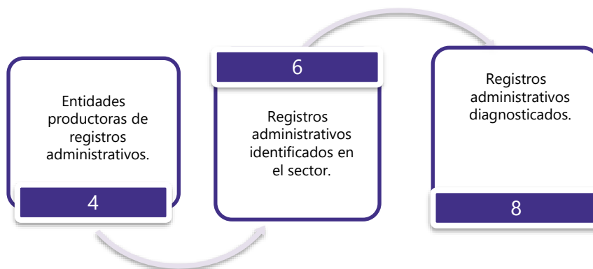
Gráfico 3. Principales características de la producción de registros administrativos del sector de Mercado Laboral y Seguridad Social