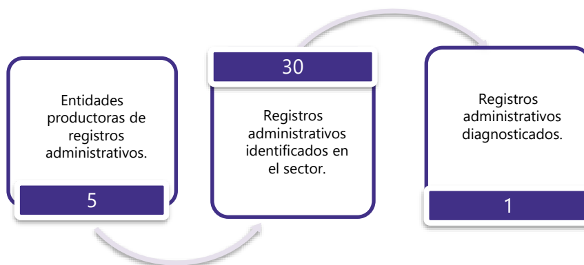
Gráfico 3. Principales características de la producción de registros administrativos del sector de Finanzas Públicas y Estadísticas Fiscales