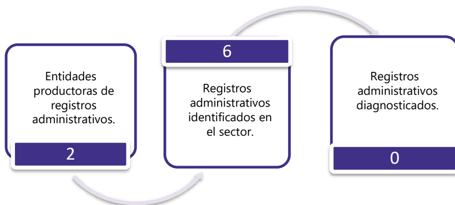
Gráfico 3. Principales características de la producción de registros administrativos del sector Deporte y Recreación