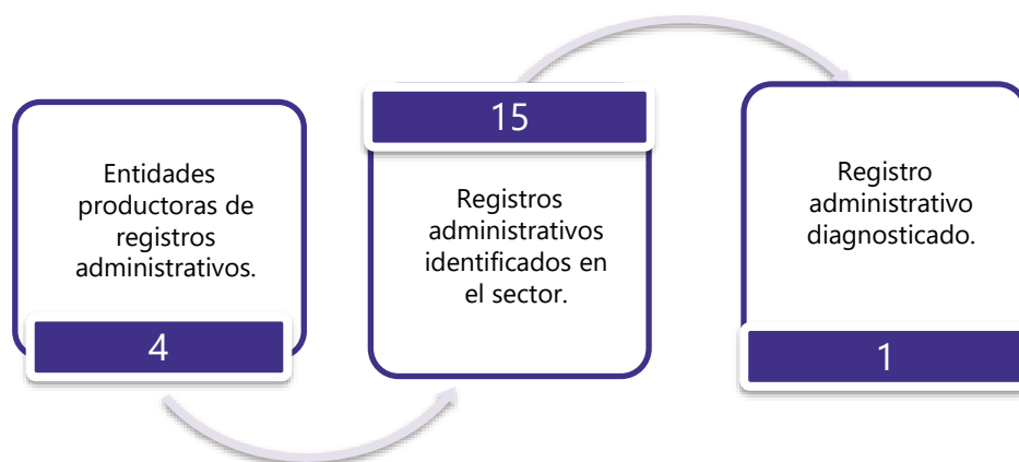
Gráfico 3. Principales características de la producción de registros administrativos del sector Demografía y Población