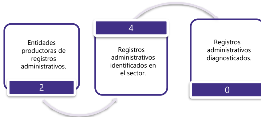
Gráfico 3. Principales características de la producción de registros administrativos del sector de Construcción