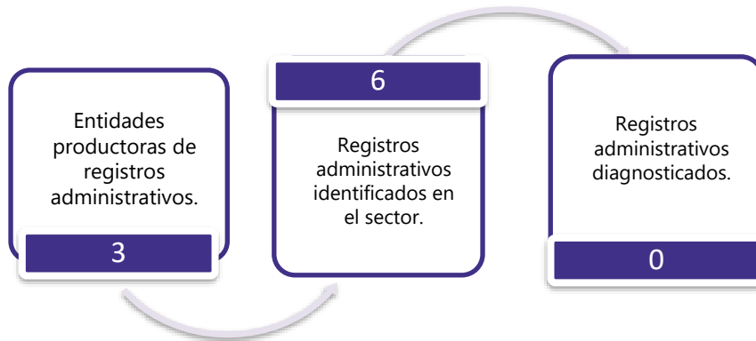
Gráfico 3. Principales características de la producción de registros administrativos del sector de Industria Manufacturera