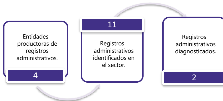
Gráfico 3. Principales características de la producción de registros administrativos del sector de Nivel, Calidad y Condiciones de Vida