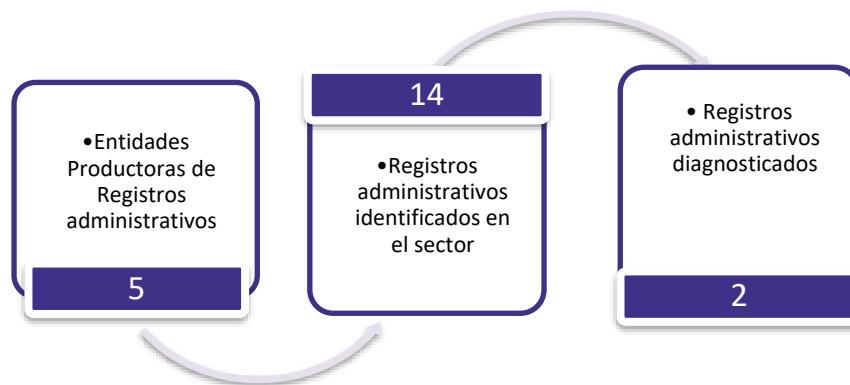
Gráfico 3. Principales características de la producción de registros administrativos del sector de Educación, Ciencia, Tecnología e Innovación