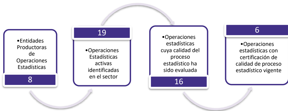
Gráfico 1. Principales características de la producción de operaciones estadísticas del sector Educación, Ciencia, Tecnología e Innovación

Fuente: DANE – DIRPEN. Inventario de operaciones estadísticas con corte al 31 de octubre de 2023.