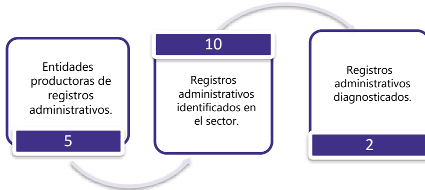
Gráfico 3. Principales características de la producción de registros administrativos del sector de Comercio