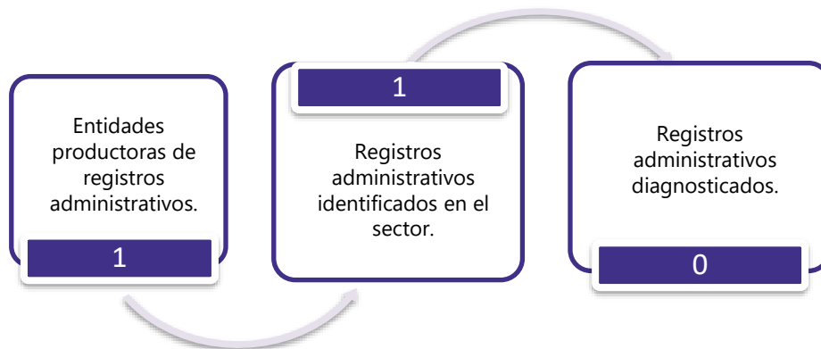
Gráfico 3. Principales características de la producción de registros administrativos del sector de Actividad Política y Asociativa