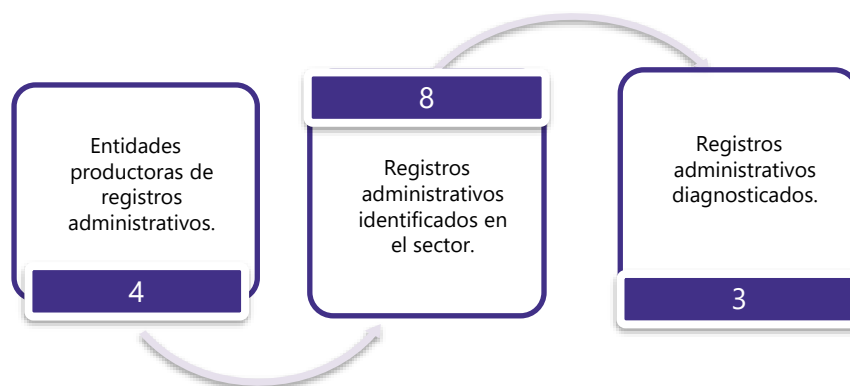
Gráfico 3. Principales características de la producción de registros administrativos del sector de Administración Pública