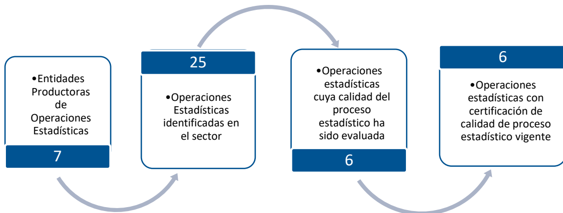
Gráfico 1. Principales características de la producción de operaciones estadísticas del sector Servicios