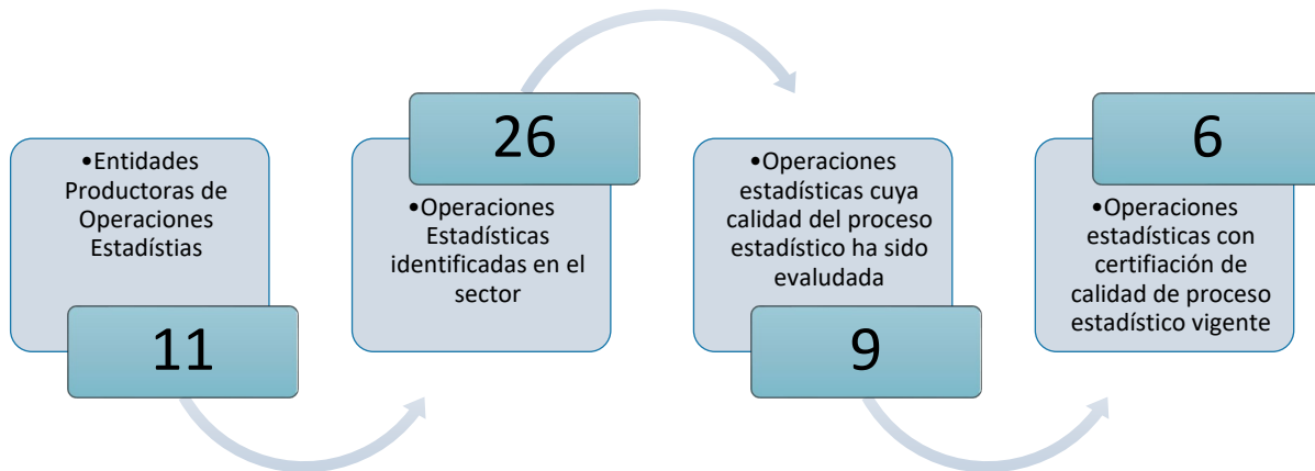
Gráfica 1. Principales características de la producción estadística del sector de Transporte