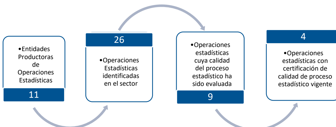
Gráfica 1. Principales características de la producción estadística del sector de Transporte