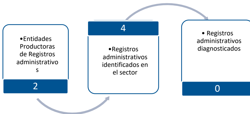
Gráfico 3. Principales características de la producción de registros administrativos del sector de Tecnologías de la Información y las Comunicaciones