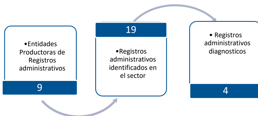
Gráfico 3. Principales características de la producción de registros administrativos del sector Seguridad y Defensa