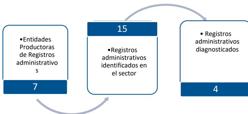
Gráfico 3. Principales características de la producción de registros administrativos del sector Salud