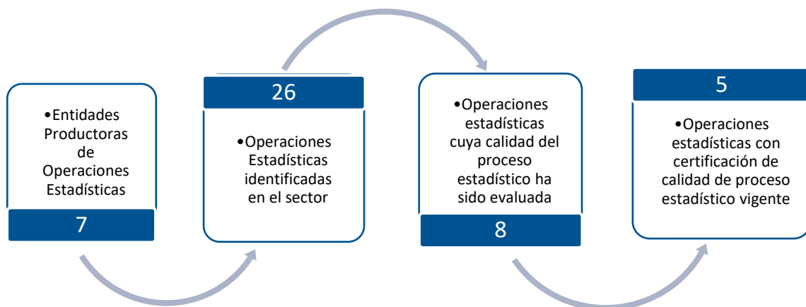
Gráfico 1. Principales características de la producción de operaciones estadísticas del sector Salud

Fuente: DANE – DIRPEN. Inventario de operaciones estadísticas con corte al 29 de octubre de 2021