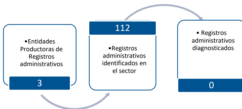
Gráfico 3. Principales características de la producción de registros administrativos del sector de Moneda, Banca y Finanzas