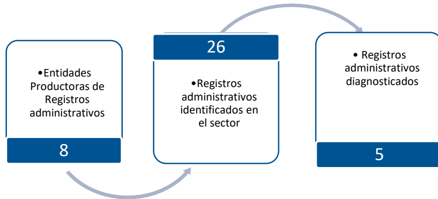
Gráfico 3. Principales características de la producción de registros administrativos del sector Minero energético