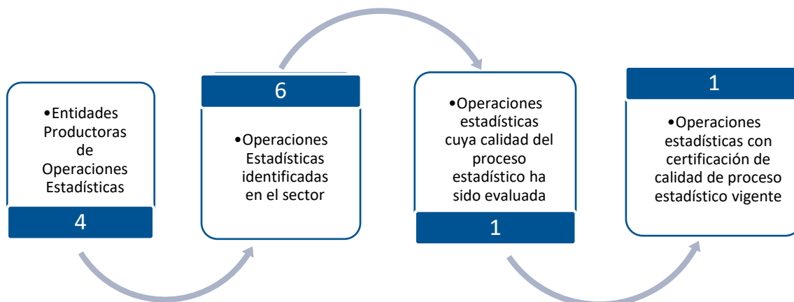
Gráfico 1. Principales características de la producción de operaciones estadísticas del sector de Mercado Laboral y Seguridad Social.

Fuente: DANE – DIRPEN. Inventario de operaciones estadísticas con corte al 26 de diciembre de 2022