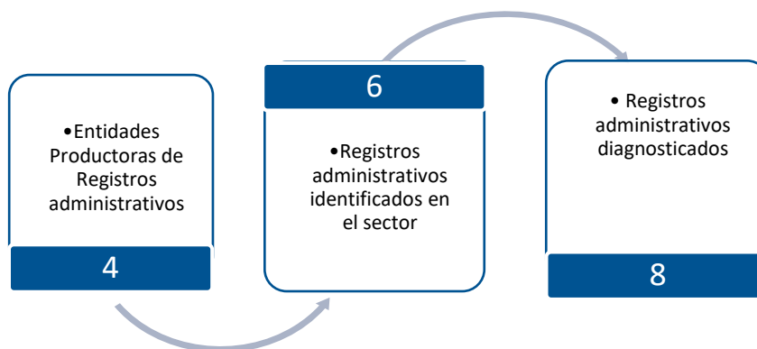
Gráfico 3. Principales características de la producción de registros administrativos del sector Mercado Laboral y Seguridad Social