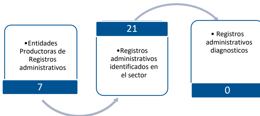
Gráfico 3. Principales características de la producción de registros administrativos del sector Justicia

Fuente: DANE – DIRPEN. Inventario de registros administrativos con corte al 26 de diciembre de 2022