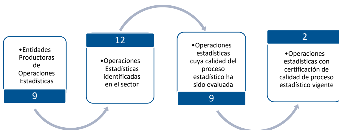
Gráfico 1. Principales características de la producción de operaciones estadísticas del sector Justicia