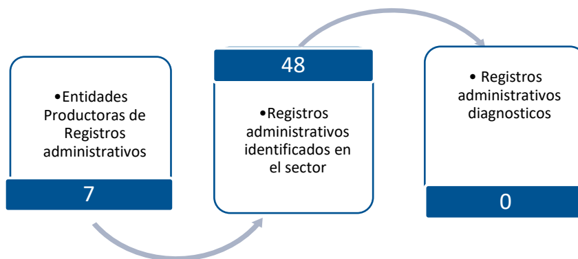
Gráfico 3. Principales características de la producción de registros administrativos del sector Justicia