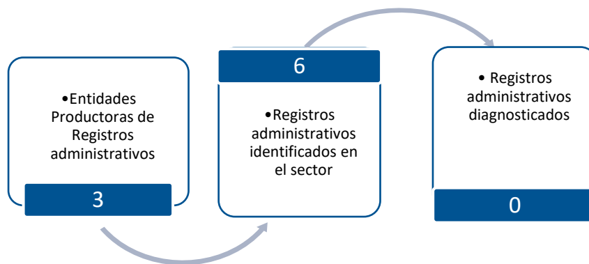
Gráfico 3. Principales características de la producción de registros administrativos del sector de la Industria Manufacturera