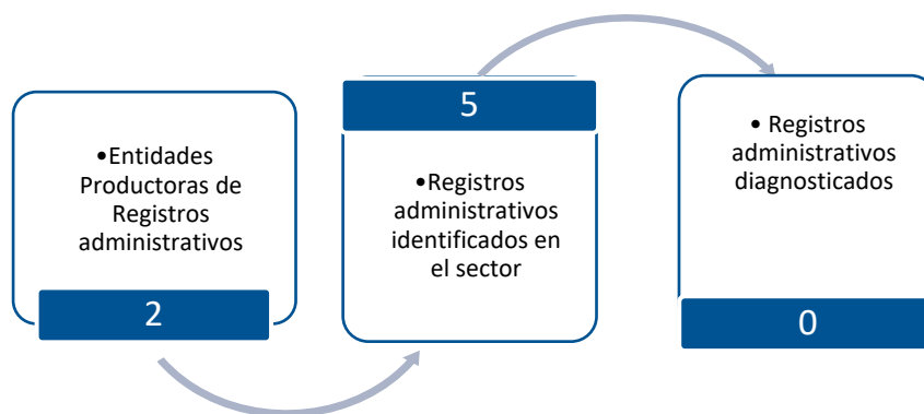
Gráfico 3. Principales características de la producción de registros administrativos del sector de la Industria Manufacturera