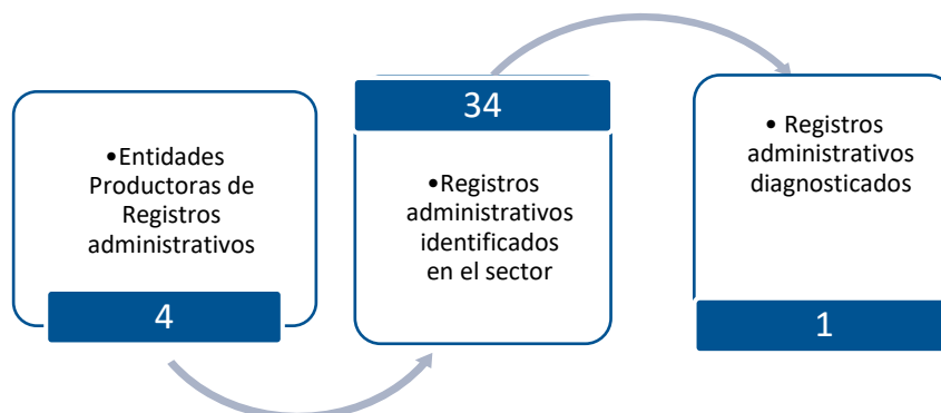
Gráfico 3. Principales características de la producción de registros administrativos del sector de Finanzas Públicas y Estadísticas Fiscales

Fuente: DANE – DIRPEN. Inventario de registros administrativos con corte al 26 de diciembre de 2022