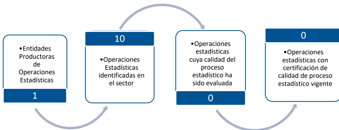
Gráfico 1. Principales características de la producción de operaciones estadísticas del sector de Deporte y recreación