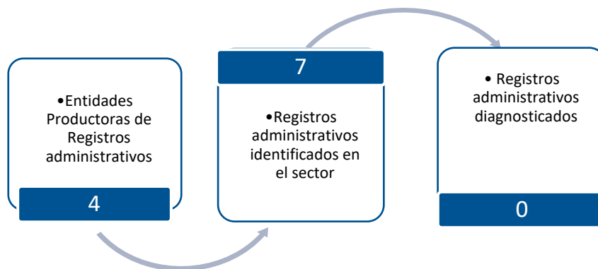
Gráfico 3. Principales características de la producción de registros administrativos del sector de Demografía y Población