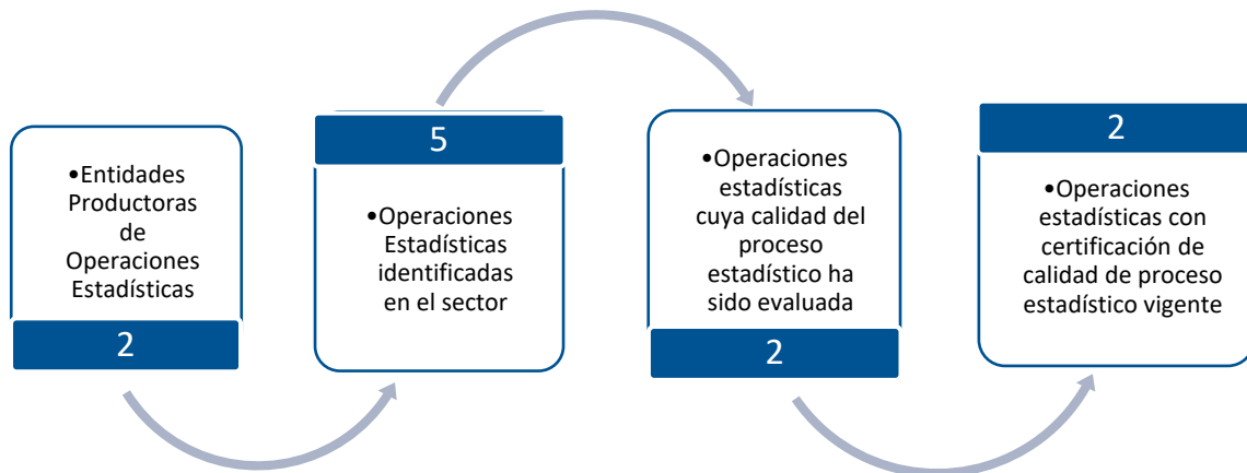
Gráfico 1. Principales características de la producción de operaciones estadísticas del sector de Demografía y población