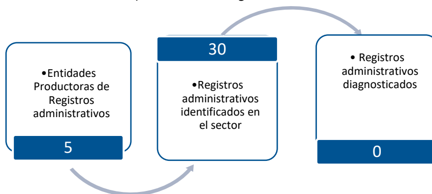
Gráfico 3. Principales características de la producción de registros administrativos del sector de Cultura