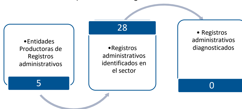
Gráfico 3. Principales características de la producción de registros administrativos del sector de Cultura