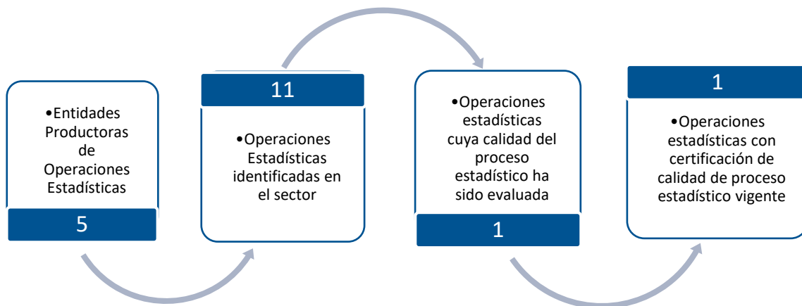
Gráfico 1. Principales características de la producción de operaciones estadísticas del sector de Cultura