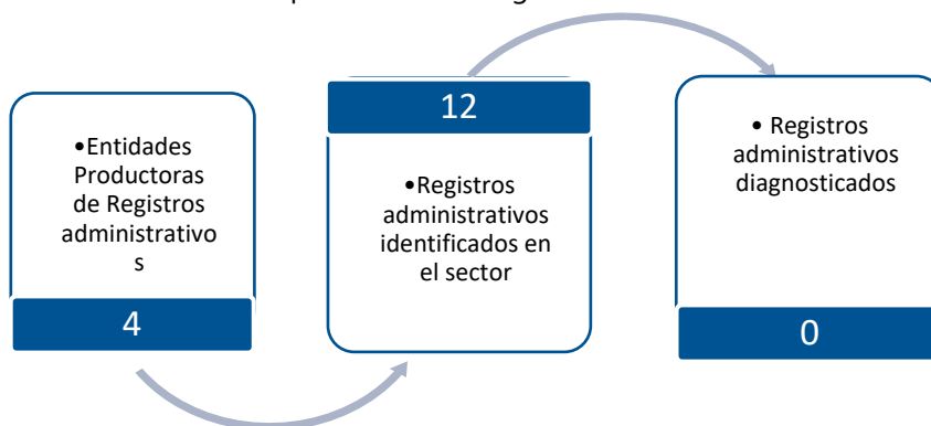
Gráfico 3. Principales características de la producción de registros administrativos del sector de Cultura