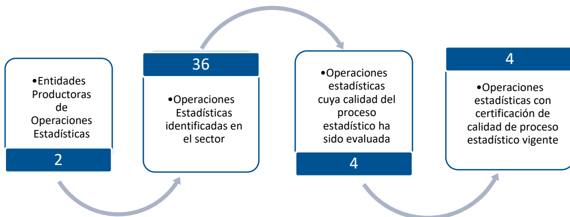
Gráfico 1. Principales características de la producción de operaciones estadísticas del sector de Cuentas Económicas

Fuente: DANE – DIRPEN. Inventario de operaciones estadísticas con corte al 15 de mayo de 2020