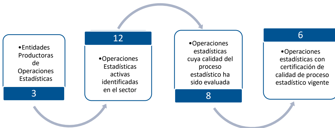
Gráfico 1. Principales características de la producción de operaciones estadísticas del sector de Construcción.