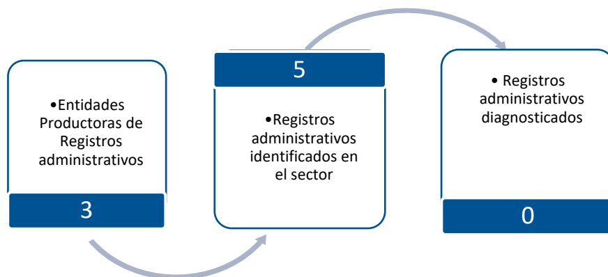
Gráfico 3. Principales características de la producción de registros administrativos del sector Comercio