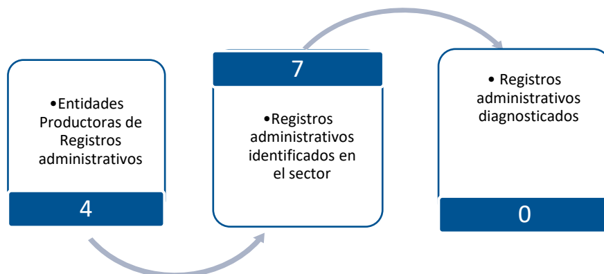
Gráfico 3. Principales características de la producción de registros administrativos del sector Comercio