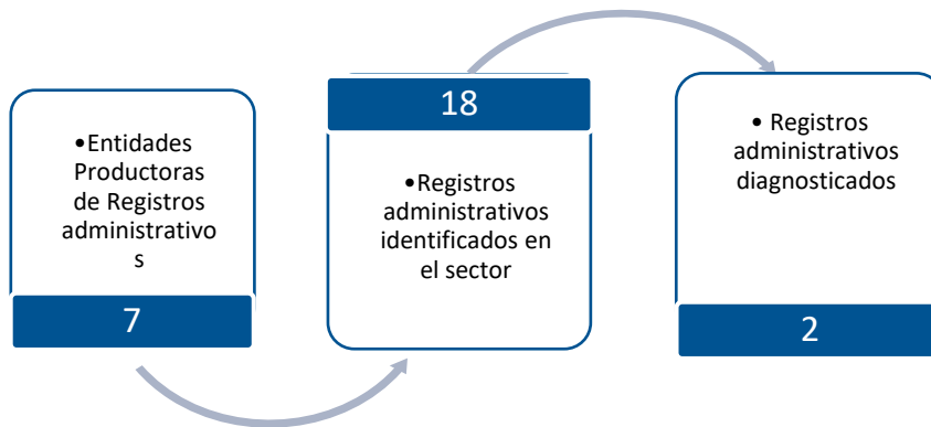
Gráfico 3. Principales características de la producción de registros administrativos del sector Ambiental