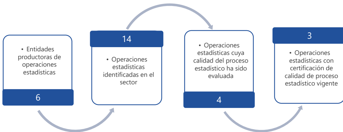
Gráfico 1. Principales características de la producción de operaciones estadísticas del sector de Administración Pública