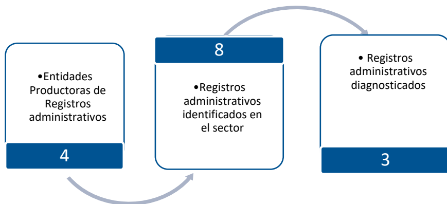
Gráfico 3. Principales características de la producción de registros administrativos del sector de la Industria Manufacturera